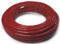
GRTMP Многослойная труба красное изоляционное покрытие (6мм) Multilayer pipe with red insulation (6mm)