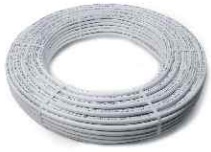
00TMP Многослойная труба Multilayer pipe