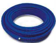
CBTMP Многослойная труба с синим гофрированным покрытием Multilayer pipe with blue corrugated protection sheath