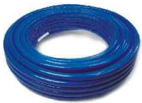
GBLTMP Многослойная труба синее изоляционное покрытие (6 мм) Multilayer pipe with blue insulation (6mm)