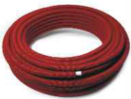
CRTMP Многослойная труба с красным гофрированным покрытием Multilayer pipe with red corrugated protection sheath